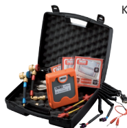
Kit diagnosi Aria Condizionata