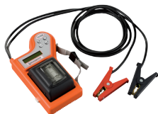
TENSO -Tester Batteria