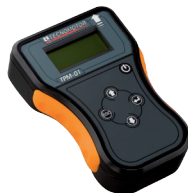
TPM-01 Tpms Reader