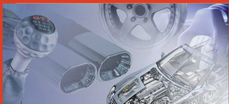
Valigia Cavi Asia

Versioni 310 (PC) - 510 (Palm) - 710 (Tablet)