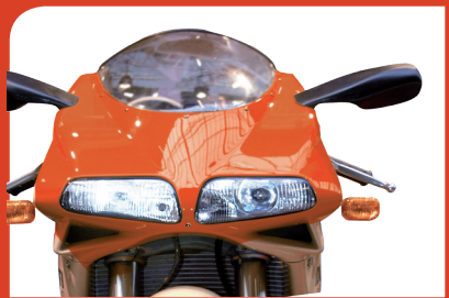
Valigia Cavi Moto

Versioni 390 (PC) - 590 (Palm) - 790 (Tablet)