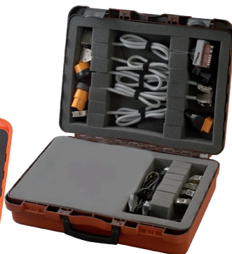
Valigia Cavi Europa