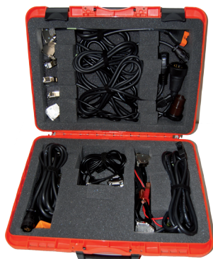
Valigia Cavi Base