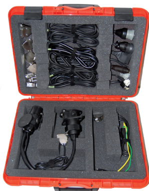
Valigia Cavi Aggiuntionale